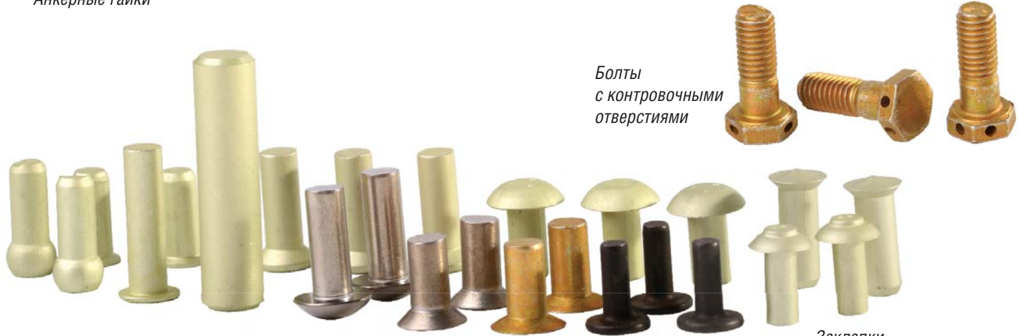
Болты с контрольными отверстиями