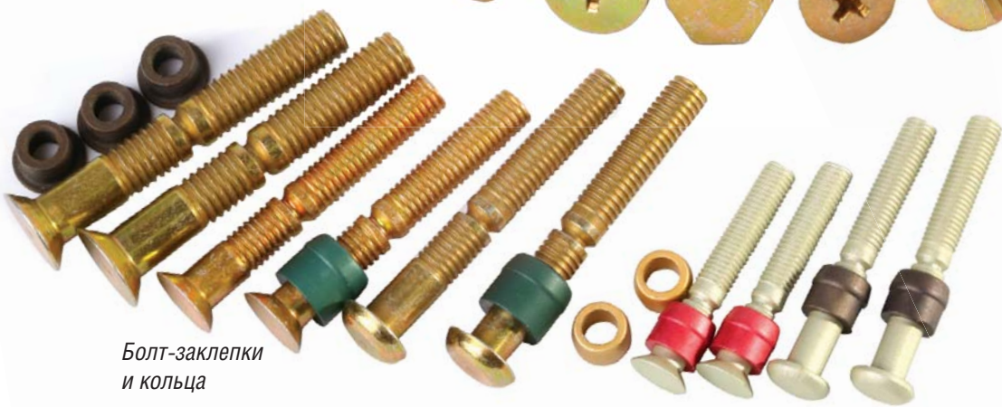
Болт-заклепки и кольца