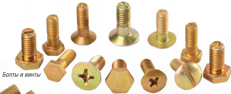
Болты и винты