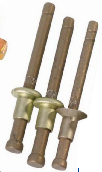
Заклепки с сердечником